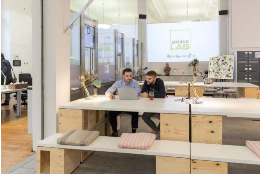
Das Office LAB bietet viel Platz, um Ideen zu entwickeln.

Wenn Sie in der 20-Minuten-App auf Ihrem Smartphone die Benachrichtigungen des Zentralschweiz-Kanals abonnieren, werden Sie regelmässig über Breaking News aus Ihrer Region informiert. Hier können Sie den Zentralschweiz-Push von 20 Minuten abonnieren. (funktioniert in der App)